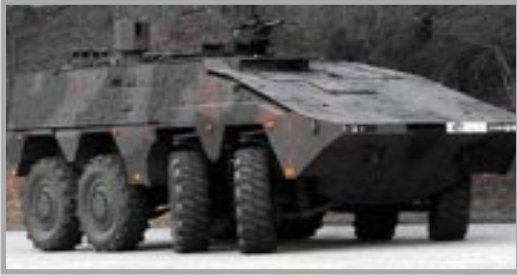
Afbeelding 5. – De 'Boxer' als CP in de toekomst?

een grote bedreiging. Om een dergelijke dreiging nog steeds het hoofd te kunnen bieden zullen de Stingerplatforms de manoeuvre moeten kunnen volgen. Met name de Fenek is voor deze taak in de voorste lijn uitstekend geschikt.