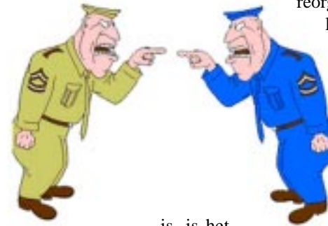
Afbeelding 6. – Samenwerking, maar dan niet zo!

Veel zaken in het gehele reorganisatietraject zijn nog onduidelijk en blijven voorlopig nog een vraagteken. Wanneer moet de militaire populatie de kazernes in Ede verlaten hebben? Hoe kunnen twee eenheden van verschillend niveau op het gebied van resultaatverantwoordelijkheid het beste worden geïntegreerd? Welke invloed hebben externe projecten zoals Fysieke Distributie, Mulan, Theatre Independant Tactical Army & Air Force Network (TITAAN), HRM-service centre, etc. op de reorganisatie, maar vooral wanneer? Hoe zien de komende jaren eruit voor wat betreft uitzendingen en welke impact heeft dit op het CoLua tijdens de