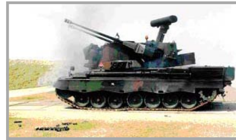
Afbeelding 1. – De Cheetah faseert uit en zal geen huisvesting meer krijgen op De Peel, behalve dan in het museum

Het huidige CoLua heeft naast de staf een opleidingspeloton, een ondersteuningspeloton en drie parate Pantserluchtdeelartillerie batterijen (11, 12 en 13) met daarin deels de wapensystemen Cheetah (Pantser Rups Tegen Lucht-doelen, 35mm) en Stinger (manpad). De 11 e Luchtverde-